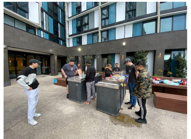
寮の中庭で寮生とバーベキュー。