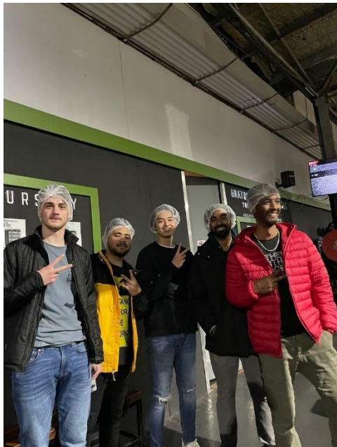
←友人と外出した際の写真。