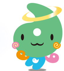
埼玉県社協マスコット 「ジャキたまくん」