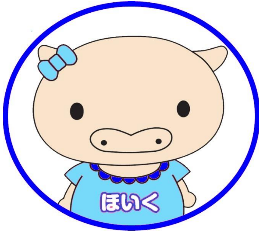
福祉人材バンクキャラクター『ほっとん』