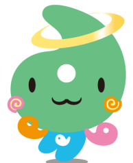
埼玉県社協マスコット 「シャキたまくん」