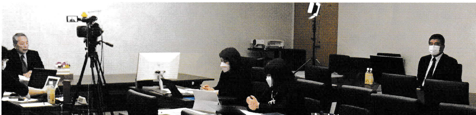
保育研修会オンライン配信の様子

子どもを取り巻く環境が目まぐるしく変化する今日、私たちは研修会を開催するにあたって保育・幼児教育の原点に立ち返り、広い視野を持って、本質的な観点からそのあり方を見極めていくことが求められていると考えます。そのため毎年、保育・教育時事に対応したタイムリーなテーマや、行政と現場の各領域における課題を統合的に学ぶことができるようなプログラムを用意しています。これまで培ってきたものを引き継ぎつつ、保育の未来のため、東京成徳から新しい風を送りたいと願っています。